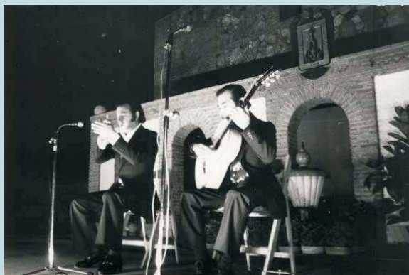
Foto: Fosforito y Juan Habichuela